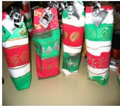
Frédérique Huot-Jeammaire (03/2007)