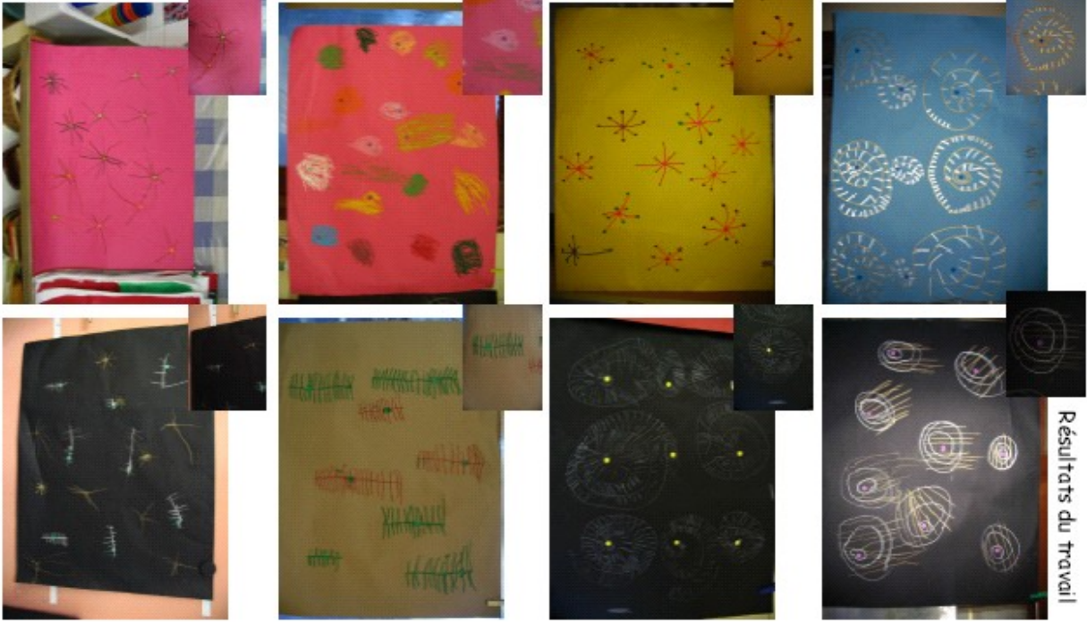
Frédérique Huot-Jeammaire (03/2007)